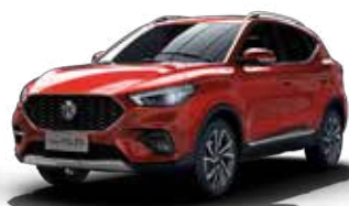
Màu Đỏ /