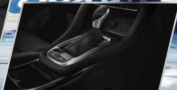
Hộp số CVT già lập 8 cấp