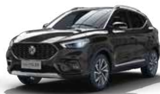
Màu Đen /