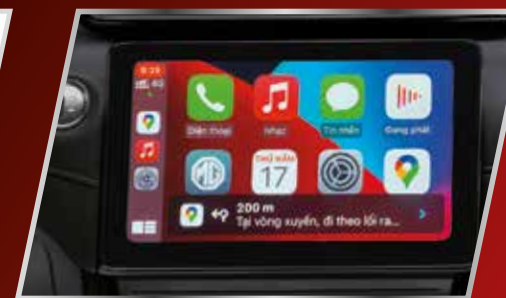
Màn hình cảm ứng 10.1" đa chức năng kết nối Apple CarPlay và Android Auto /