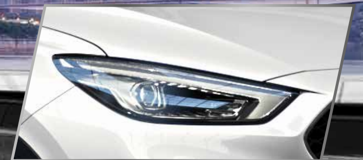
Đèn pha FULL LED /