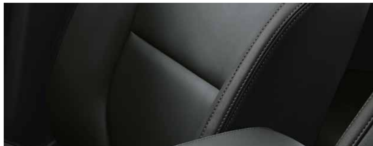
Màu Đen /