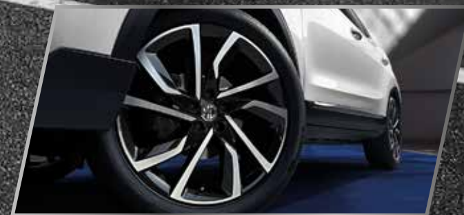
Mâm xe 17" /