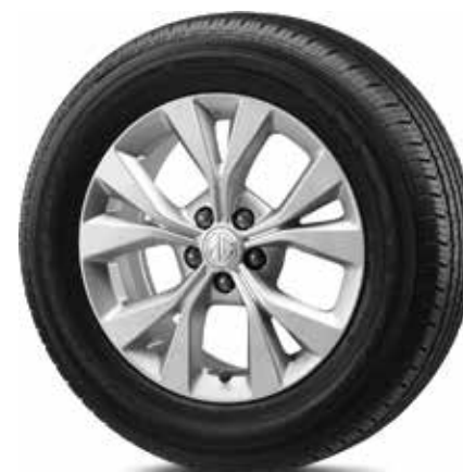
Mâm xe hợp kim nhôm 16"