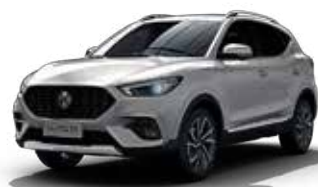
Màu Trắng /