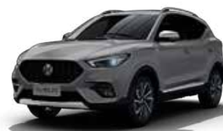
Màu Bạc /