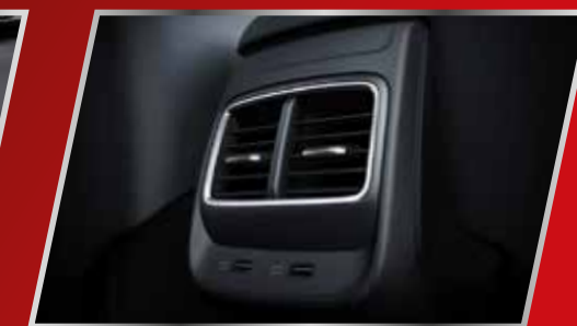
Cửa gió điều hòa hàng ghế sau /