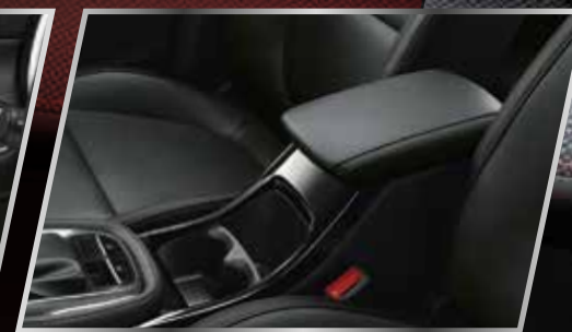
Bộ tỷ tay /