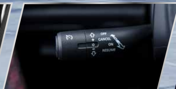
Cruise control (Ga tự động)