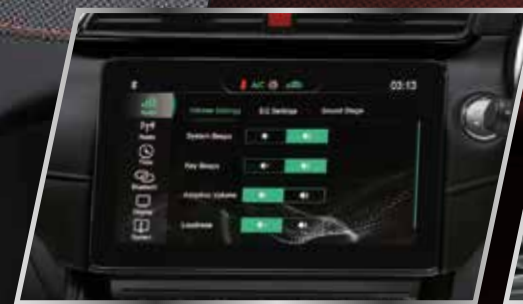
Màn hình cảm ứng 10.1" /

Các chi tiết trong khoang nội thất của MG ZS MỚI được thiết kế cách tân và chế tạo tỉ mỉ với các chi tiết mạ kim loại. Mọi chi tiết trên xe đều thể hiện tính thể thao sang trọng, từ bảng điều khiển được trang trí đặc biệt bằng vật liệu mềm cho đến MÀN HÌNH CẢM ỨNG 10.1". Bạn sẽ thoải mái tận hưởng mọi hành trình với ghế lái chỉnh điện 6 hướng. Cửa sổ trời toàn cảnh diện tích 1.19m 2 , diện tích mở tối đa lên đến 0.49m 2 với 7 chế độ mở. Bạn sẽ có những trải nghiệm hoàn toàn mới trên mọi hành trình và khám phá thế giới theo một cách hoàn toàn khác biệt.