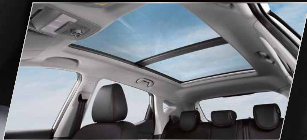
Cửa sổ trời toàn cảnh với 7 chế độ mở /