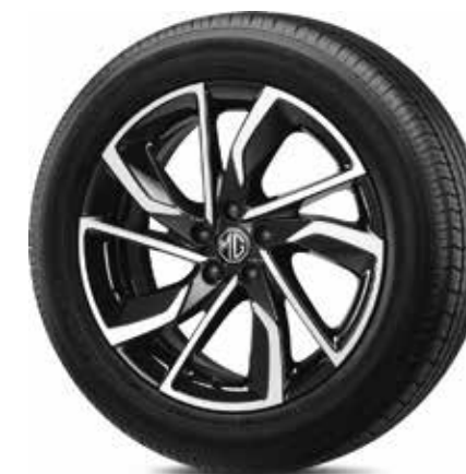
Mâm xe hợp kim nhôm 17"