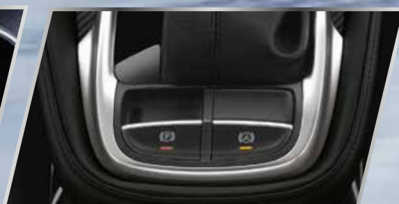
Phanh tay điện tử & giữ phanh tự động