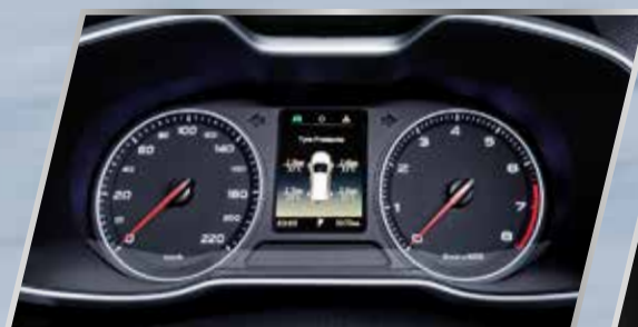
Kiểm soát áp suất lốp trực tiếp

Khi xe khởi hành lại sau khi dừng trên dốc, hệ thống sẽ tự động điều khiển phanh trong khoảng 2 giây để tránh xe bị trượt để tăng cường an toàn cho lái xe trong khi khởi hành.