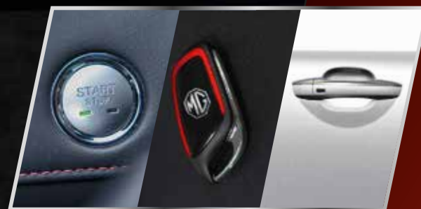
Nút khởi động Start/Stop & Chìa khóa thông minh /