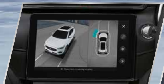
Camera 360° hiển thị 3D