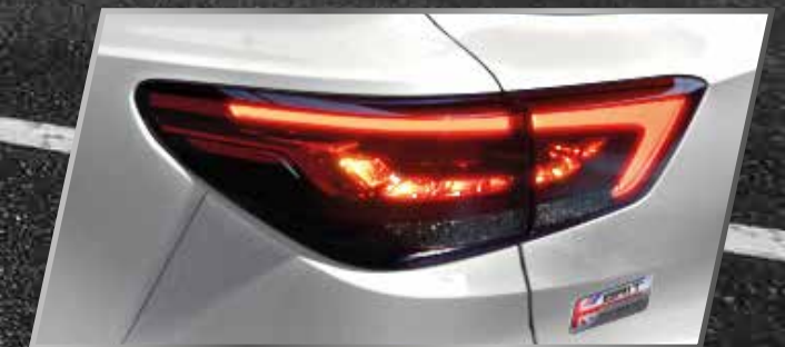
Đèn hậu LED /