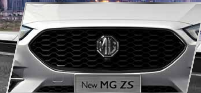
Lưới tản nhiệt thể thao /

MG ZS MỚI nổi bật trên mọi cung đường với lưới tản nhiệt phía trước được cách tân và những đường nét thiết kế mang phong cách Anh Quốc độc đáo. Thiết kế được nâng tầm với đèn pha tự động kết hợp với dải LED ban ngày bắt mắt. Đèn hậu mới cũng được cải tiến về mặt thiết kế, bộ mâm hợp kim 17" với thiết kế thể thao cũng làm tăng thêm vẻ sang trọng cho chiếc xe. MG ZS mới đang làm thay đổi định nghĩa về Thiết kế thông minh - thiết kế đáp ứng được mọi nhu cầu của cuộc sống hiện đại.