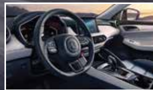
Vô lăng D-Cut thể thao và tích hợp Sport mode *