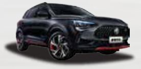
Đen Ngọc trai (Black Pearl)