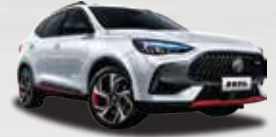
Trắng Kem (York White)