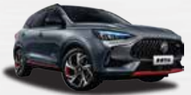
Xám Tro (Metal Ash)