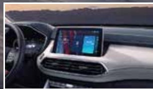
Màn hình giải trí 10.1" & Âm thanh 6 loa