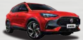
Đỏ Lửa (Flare Red)

*Thông số kỹ thuật trên mang tính chất tham khảo có thể thay đổi theo thực tế mà không cần báo trước.