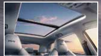
Cửa sổ trời toàn cảnh Panorama