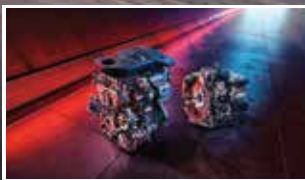
1.5 Turbo 160 HP & Hộp số ly hợp kép 7 cấp